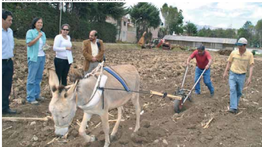
Demostración de herramienta multiusos para cultivos - Cultivadora INIA.