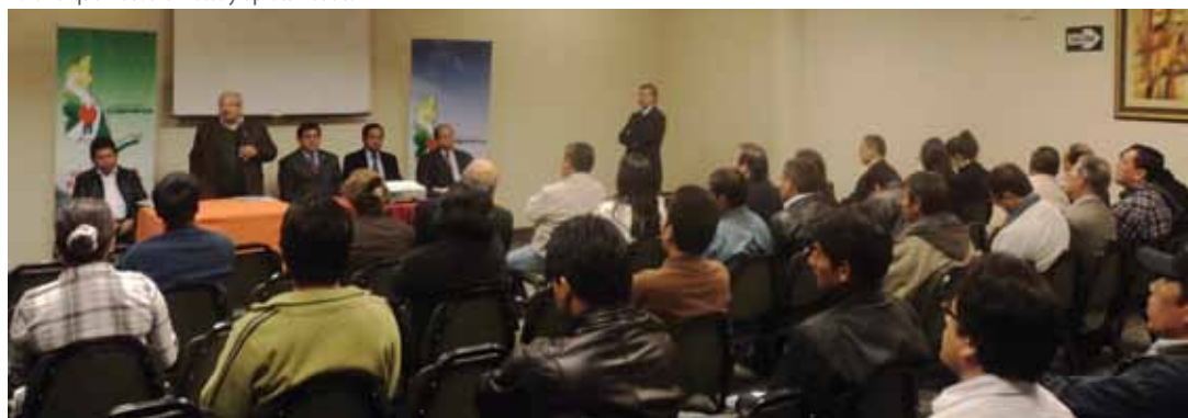
Foro Parque Industrial Retos y Oportunidades

Asimismo socializar en los empresarios locales el proyecto “Parque Industrial de Cajamarca” como alternativa de desarrollo y las empresas industriales (micro, pequeña, mediana y gran empresa). Sensibilizar en los empresarios locales su apoyo y participación en la ejecución de este proyecto, tanto como promotores así como usuarios del parque industrial y difundir las fortalezas y competitividad de la actividad industrial desarrollada desde un parque industrial para satisfacer las necesidades de un mercado que demanda, cada vez más, productos de calidad.