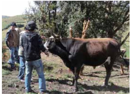
Evaluación de ganado

710 caseríos beneficiarios. 26 586 familias beneficiarias S/. 16'811,134.00 nuevos soles se invierten.