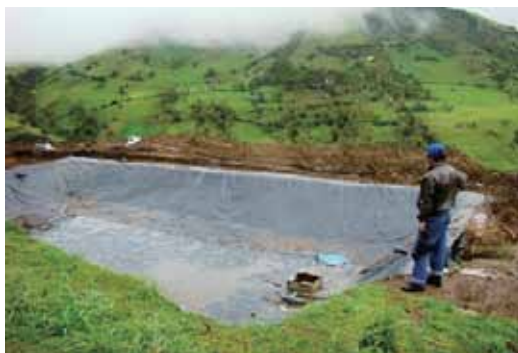
Reservorio con geomembrana - Quilupay