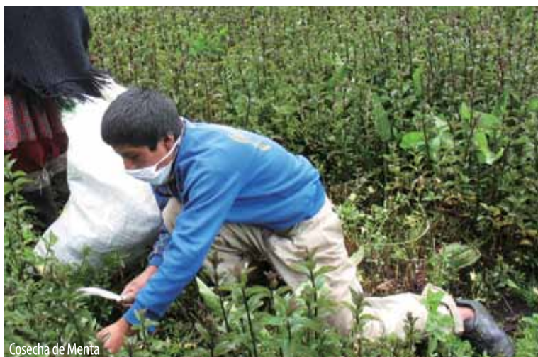
Cosecha de Menta

2007 se inicia un nuevo proyecto denominado: “Manejo sostenible de plantas medicinales para el biocomercio: valeriana, diente de león, chamcua, salvia y romero”.