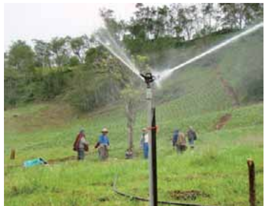
Prueba del sistema de riego – La Lava – Catilluc

La Gerencia Regional de Desarrollo Económico – GRDE, como una estrategia de corto plazo, está realizando trabajos de campo para la identificación y