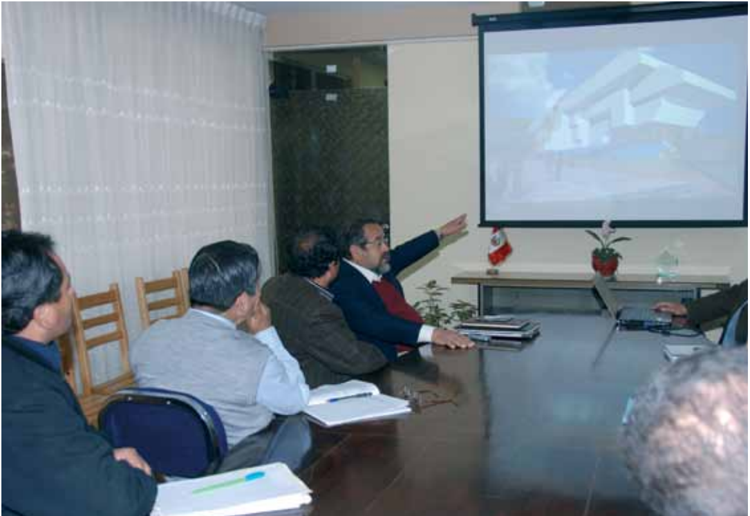
Arequeólogo Walter Alva presentando el proyecto

Asimismo, el Museo Regional de las Culturas de Cajamarca será un gran centro de efervescencia cultural, en tanto ofrecerá anfiteatros, salas de exposiciones, espacios para talleres, auditorios, entre otros, locaciones tan necesarias para impulsar el quehacer artístico cultural de la Región.