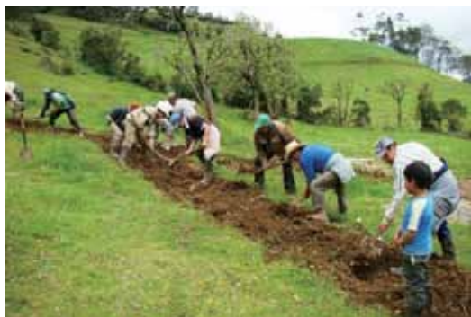
Faena de enterrado de tubería de distribución – La Lava

En el período 2011, se elaboraron 02 Expedientes Técnicos, el PIP “Instalación de Riego Tecnificado en el Caserío El Tablón y Juan Velazco Alvarado, Distrito de Chirinos – Provincia San Ignacio y el Proyecto “Mejoramiento del Canal Santa Ana, Distrito Sitacocha, Provincia de Cajabamba”, la ejecución de estos proyectos demandan una inversión de aproximadamente 4 millones de soles, con una área bajo riego de 550 ha, beneficiando a 202 familias.