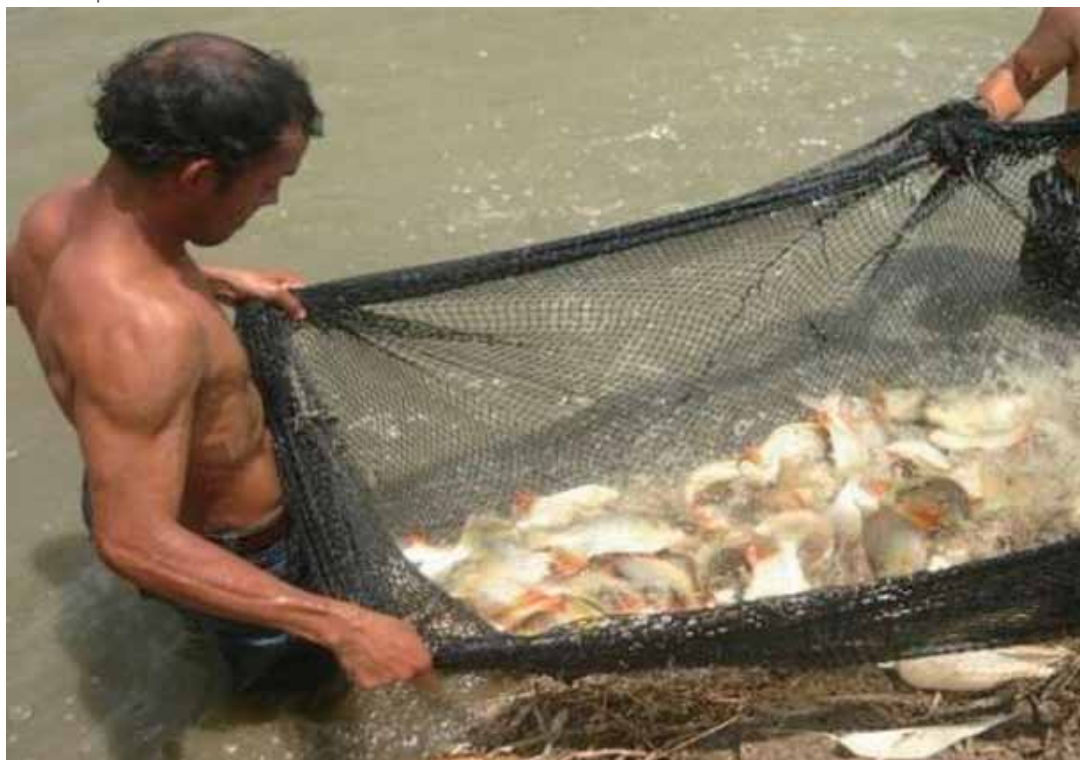
Pesca de Tilapia

El Gobierno Regional Cajamarca a través de la Dirección Regional de la Producción y la Dirección Sub Regional de la Producción Jaén - San Ignacio, vienen fortaleciendo la acuicultura en las provincias de Jaén y San Ignacio, propiciando la generación del valor agregado al potencial hídrico de este territorio amazónico y fronterizo.