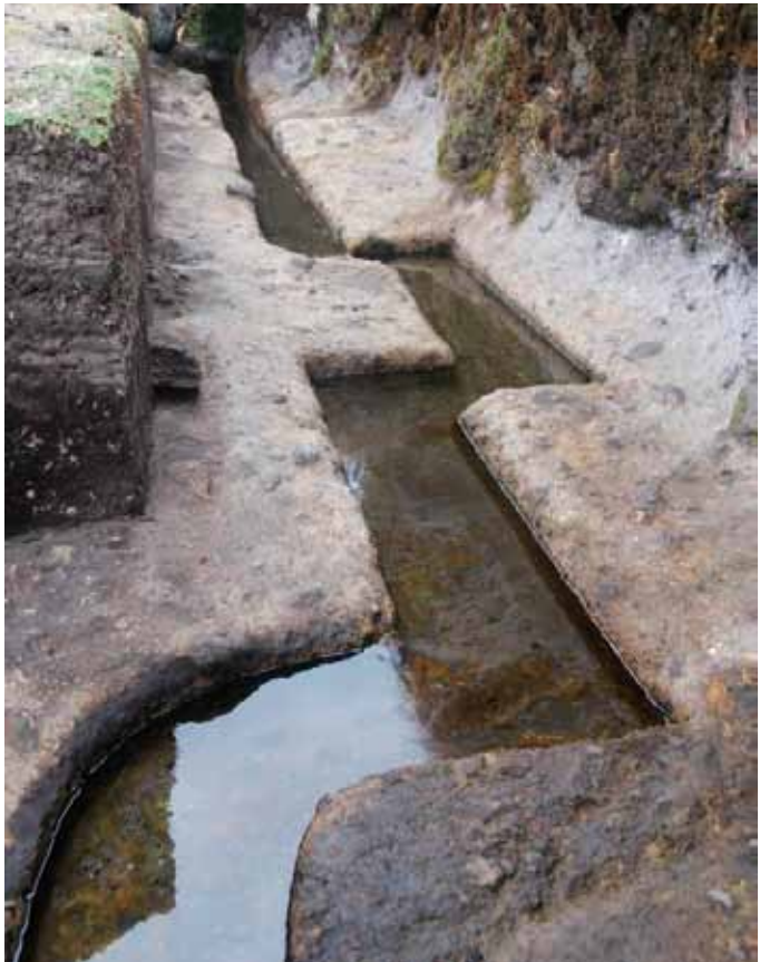
Canal de Cumbemayo

Adicionalmente, la Gerencia Regional de Desarrollo Económico y la DIRCETUR Cajamarca, implementarán una serie de actividades complementarias para garantizar la inserción de la comunidad en la dinámica turística que el proyecto “Puesta en valor y acondicionamiento turístico de la ruta del agua Cumbemayo” va a generar. Una de estas acciones es la de motivar a los campesinos a desarrollar parcelas demostrativas y de reforestación con especies nativas, que cultivaban los Cumbemayo, que tendrán múltiples usos y beneficios: servirán de espacio de actividades de recreación y animación turística, valdrán como banco de germoplasma de especies originarias y mejorarán el paisaje.