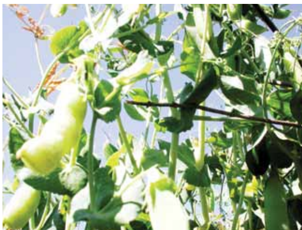
Plantación de Arveja

Como parte de la política del Gobierno Regional Cajamarca, de promover la generación y transferencia de tecnología; y, luego de sostener varias reuniones entre el Equipo Técnico Japonés y las autoridades de las diversas instituciones como Gobierno Regional de Cajamarca, AgroRural, INIA y Municipalidades de Cajamarca, Cajabamba, San Marcos - Ichocán, San Pablo y San Miguel como contrapartes en el proyecto, en el mes de octubre del año 2010, acordaron y firmaron el documento titulado: Minuta de reuniones sobre el proyecto "Incremento de los ingresos económicos de los pequeños productores agrarios en la región de Cajamarca"-IEPARC . De igual manera, se firmó el documento denominado "Fondos necesarios para la operación del proyecto", mediante el cual cada una de las instituciones de Cajamarca se comprometieron a aportar con recursos humanos especializados, terrenos y recursos financieros para la operatividad del proyecto.