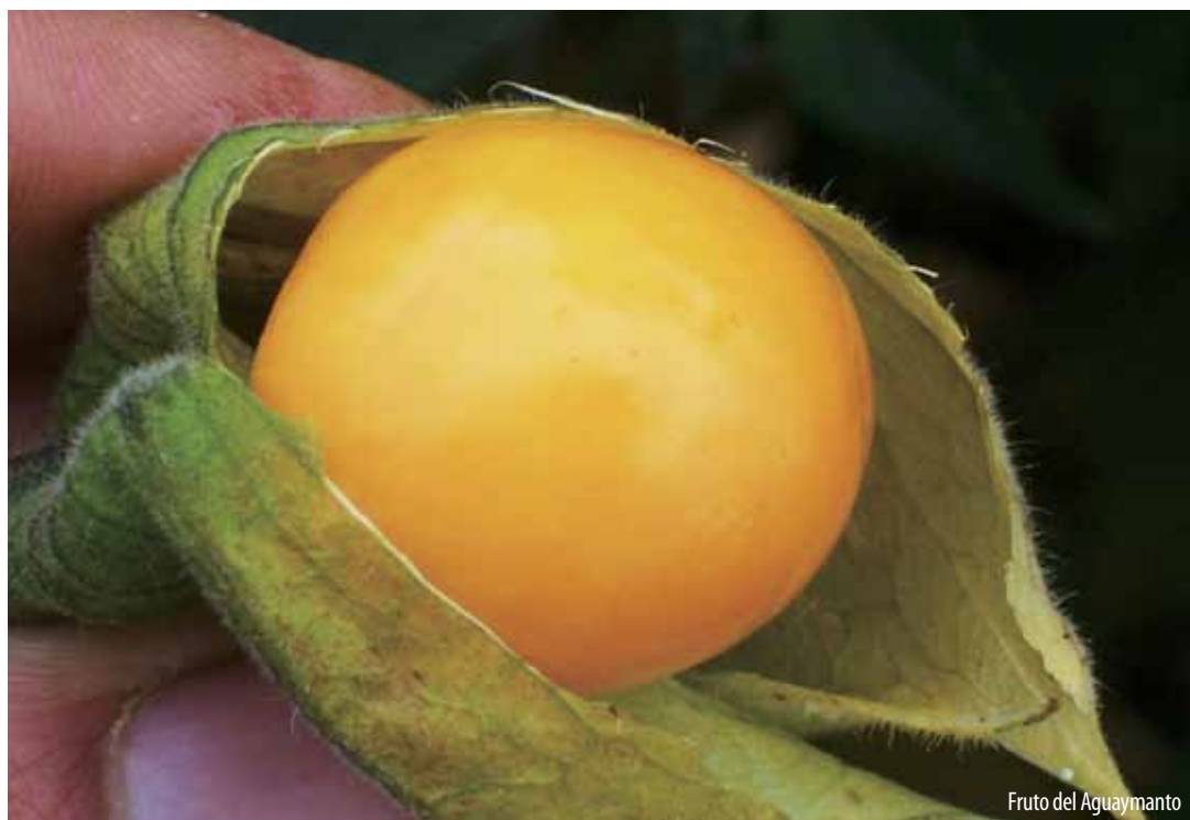
Fruto del Aguaymanto

El proyecto “Optimizar provisión de servicios agrarios de la Dirección Regional de Agricultura Cajamarca” permitirá promover las cadenas productivas de la palta, aguaymanto, tara y del cuy”.