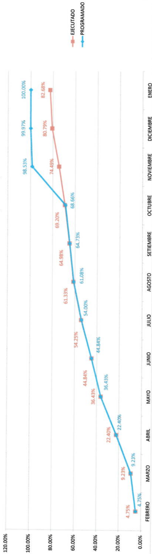
CURVA ACUMULADO ACTUALIZADO VS. ACUMULADO EJECUTADO (AL 31.01.17)

Maximo Borja Tafur INGENIERO CIVIL CIP N° 40557