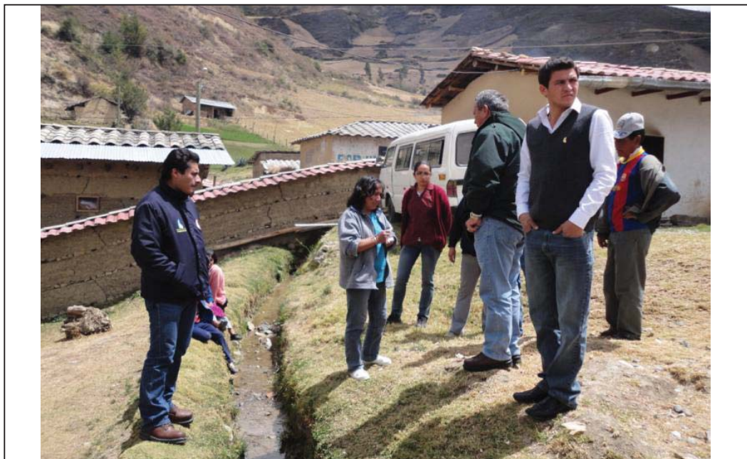
FOTO N° 05 : Otra vista del Director de la Oficina de Defensa Nacional, juntamente con personal técnico de dicha dirección y personal docente de la I.E. N° 82193, donde se aprecia que el canal de drenaje de aguas superficiales no se encuentra canalizado y pone el riesgo de los estudiantes en tiempos de lluvia, determinándose para su canalización el apoyo con 100 bolsas de cemento.

“Año del Centenario de Machu Picchu para el Mundo”