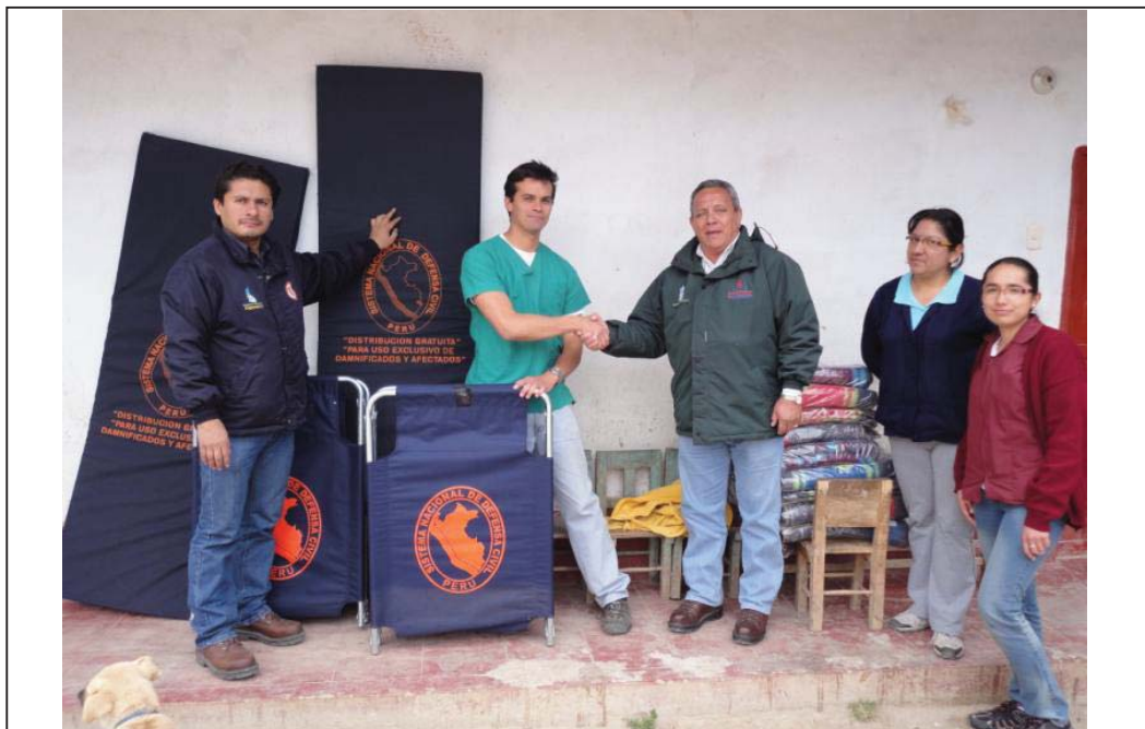
FOTO N° 04 : Vista de la entrega de camas y colchones al representante del Puesto de Salud San Pablo de Jesús, con el objetivo de que contemple la logística mínima y necesaria para atención de enfermedades respiratorias.