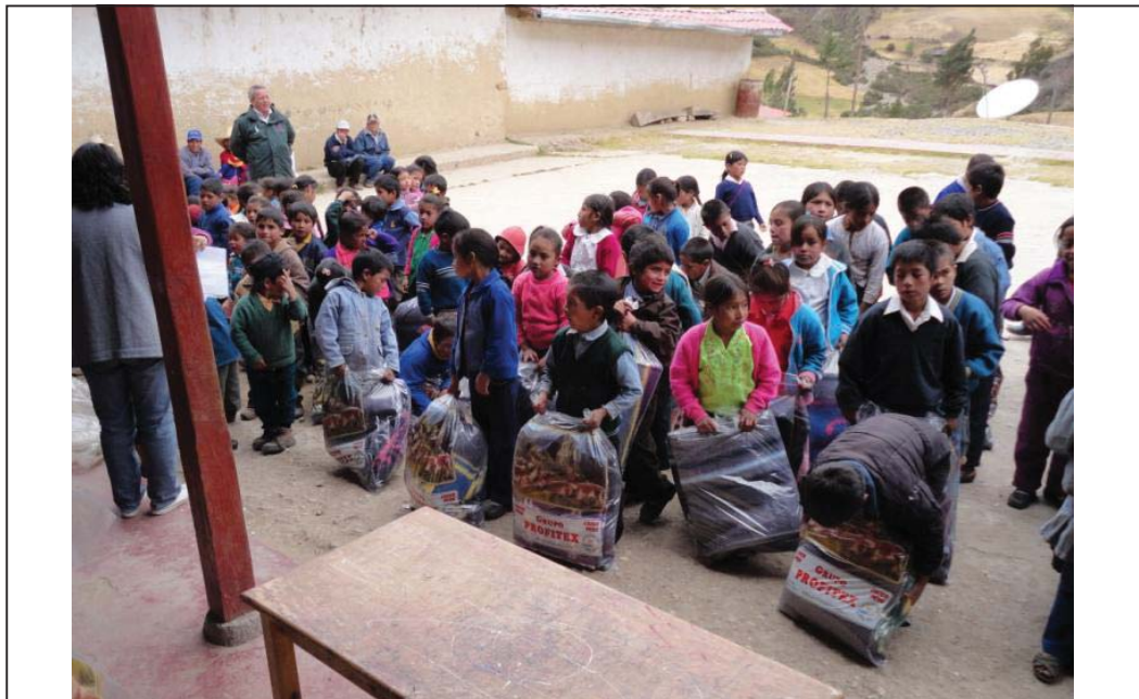
FOTO N° 03 : Vista de los niños que ya han recibido las frazadas directamente para su uso personal durante esta temporada de frío que viene asolando en la localidad de San Pablo de Jesús.

“Año del Centenario de Machu Picchu para el Mundo”