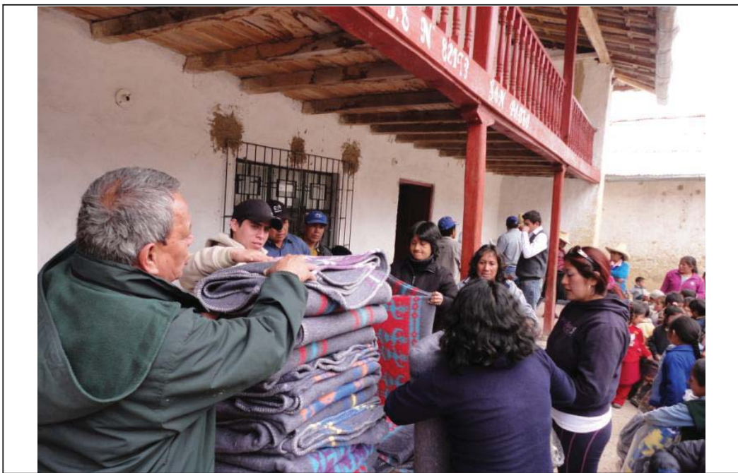
FOTO N° 02 : Vista de la disposición de las frazadas junto con el personal docente para la entrega directa de las mismas a los beneficiarios, en este caso los niños de la I.E. N° 82193 y del PRONOEI del lugar.