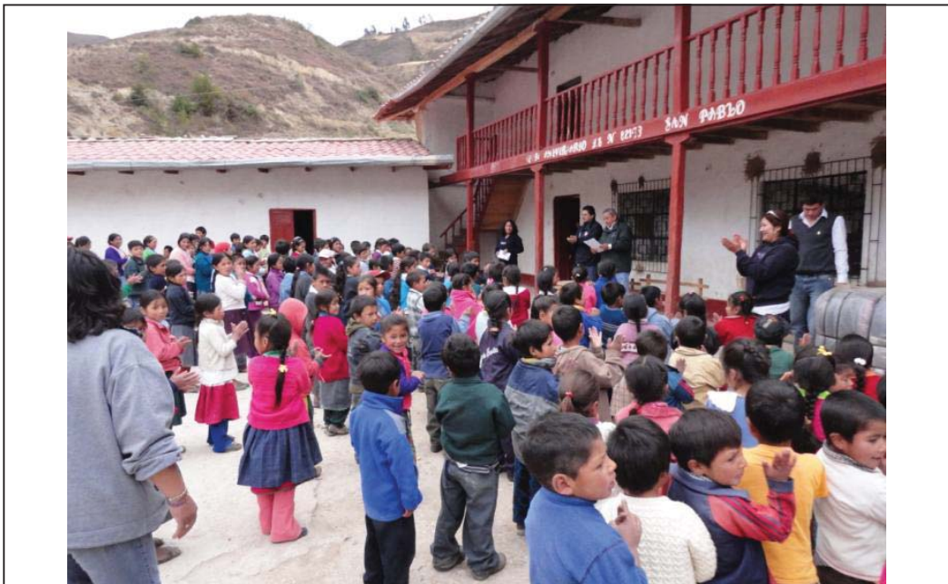
FOTO N° 01 : Vista del suscrito y personal de la Oficina de Defensa Nacional, en compañía de personal docente y autoridades de la localidad de San Pablo del Alto, llevando a cabo la reunión de entrega de los bienes de apoyo.