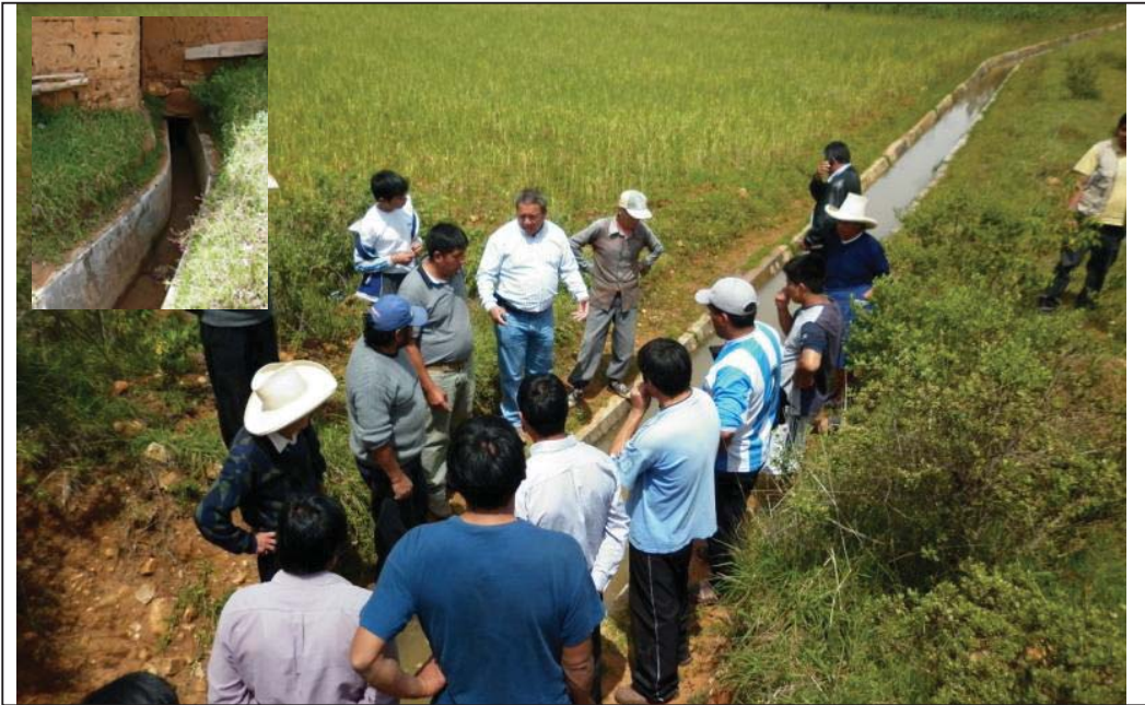
FOTO N° 05 : Otra vista del Director de la Oficina de Defensa Nacional, juntamente con usuarios del canal Lanchiloma - Chilacat, donde se aprecia que este canal se encuentra interrumpido, debido al derrumbe de un talud lateral del mismo. En la foto de la parte superior izquierda, se aprecia que este canal también atraviesa una vivienda por su base de fundación.