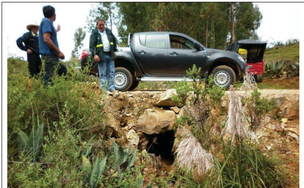
FOTO N° 03 : Vista del Director de la Oficina de Defensa Nacional, revisando el grado de colmatación de las alcantarillas de piedra acomodada, las cuales tampoco han contemplado la limpieza de las mismas.

“Año del Centenario de Machu Picchu para el Mundo”