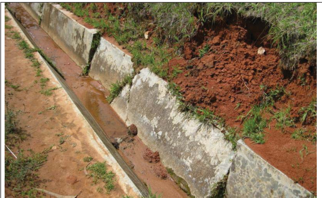
FOTO N° 06 : Otra vista del canal Lanchiloma – Chilacat, donde se aprecia la falta de mantenimiento del mismo, así como la colmatación y perfilamiento de taludes, lo que ha generado el fracturamiento de algunos tramos del canal.