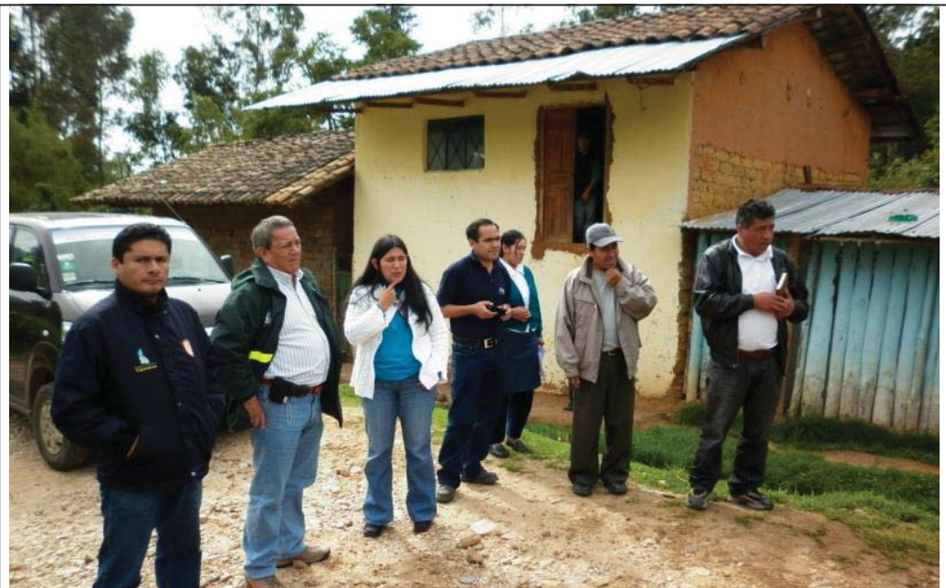
FOTO N° 01 : Vista del suscrito y personal de la Oficina de Defensa Nacional, en compañía del Alcalde de Namora, su Secretaria Técnica de Defensa Civil, dos regidores del Consejo Municipal y un representante edil más.