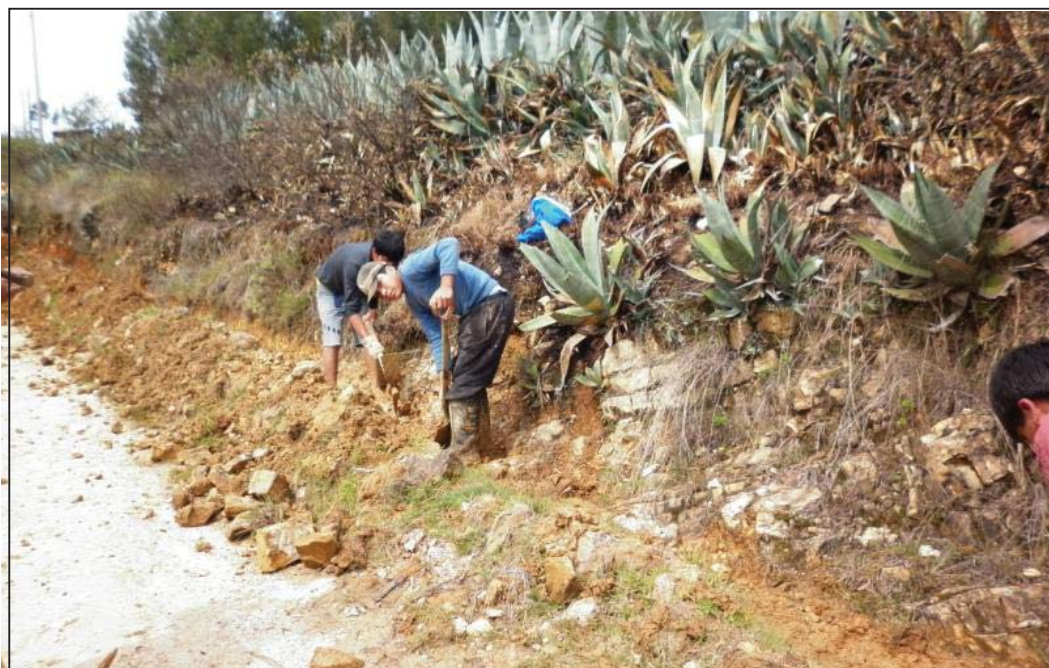
FOTO N° 04 : Vista en un tramo crítico, donde algunos pobladores conscientes vienen recién realizando los trabajos de mantenimiento, después de que ya han sucedido los problemas de desborde de las aguas de lluvia.