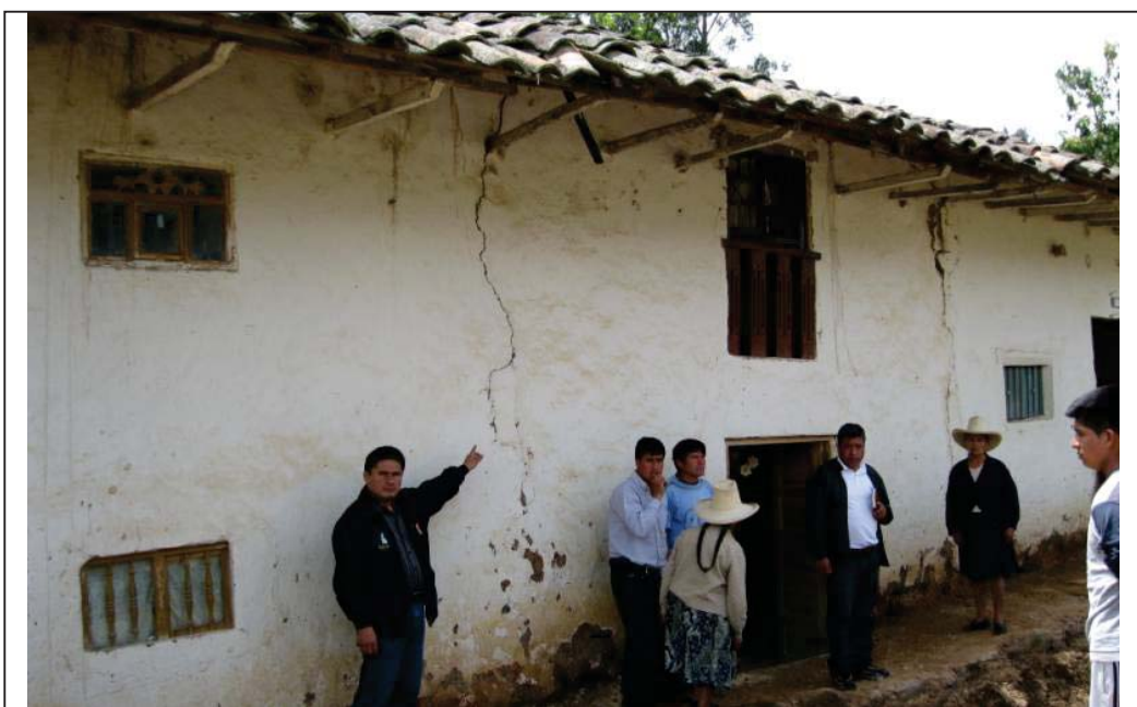
FOTO N° 08 : Vista del frontis de la vivienda afectada, donde se aprecia el agrietamiento de los muros, debido a la inundación presentada, donde el nivel del curso del agua está sobre el nivel de la vivienda.