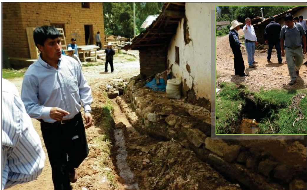
FOTO N° 07 : Vista de una vivienda que ha instalado una cocina sobre el cauce del recorrido de las aguas de escorrentía de lluvia, tratando de desviarlas; en la foto de la parte superior derecha se aprecia que el canal atraviesa la calle y va a dar directamente a la vivienda.