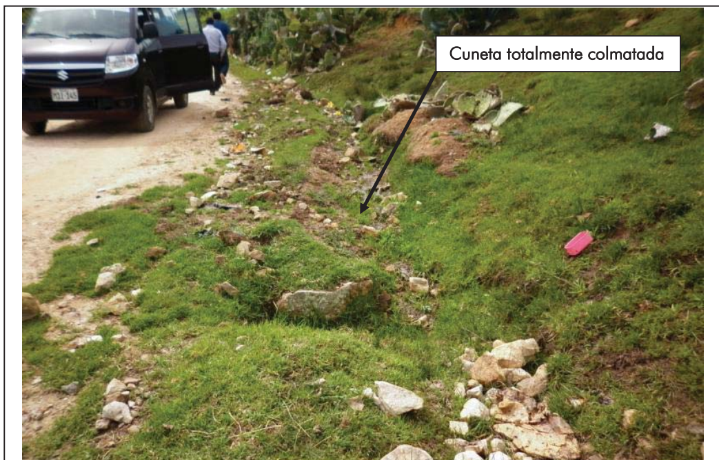
FOTO N° 02 : Vista de una de las muchas cunetas de la carretera Namora – Chilacat, donde se puede apreciar la considerable colmatación que contemplan estas, debido a la falta de mantenimiento por parte del Gobierno Local y de los pobladores.