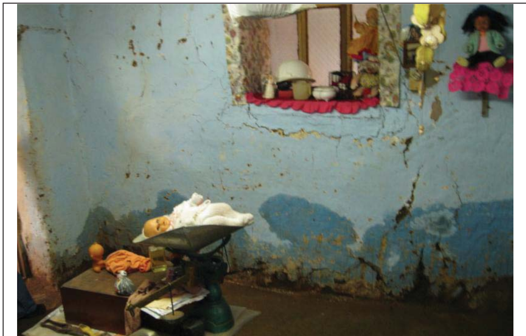
FOTO N° 09 : Vista del interior de la vivienda afectada, que por instalarse cerca del curso de la escorrentía de agua de la parte alta, se ve siempre afectada por inundación, siendo de responsabilidad absoluta del propietario.

“Año del Centenario de Machu Picchu para el Mundo”