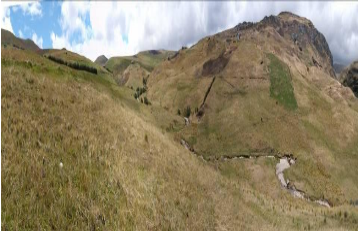
Fotografía N° 13: Vista hacia el cerro Taru Orco y el lomo el Toro y la Vaca, con dirección hacia el futuro dique del depósito de relaves.