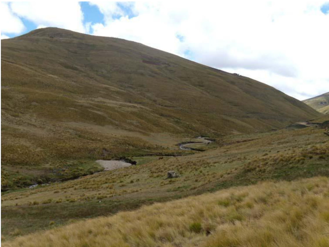
Fotografía N° 12: Cobertura cerro Mojón, Río Grande, brazo del depósito de relaves.-