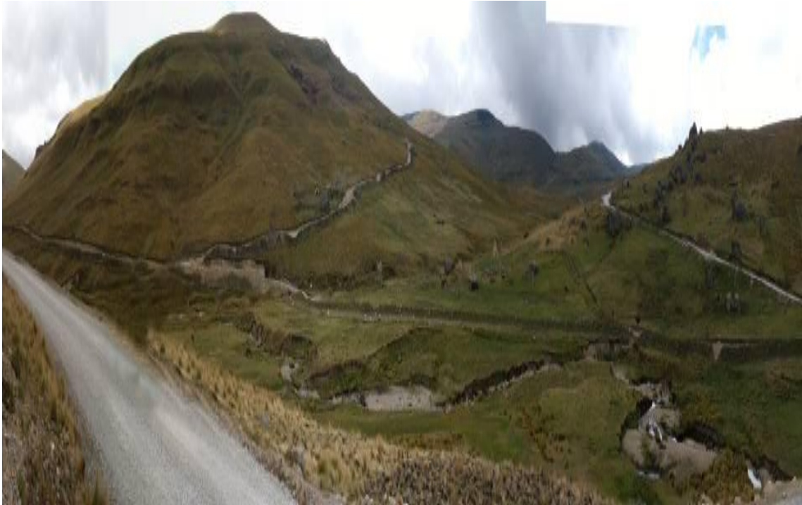
Fotografía N° 11: Vista desde el camino, en la futura área del depósito de relaves con vista hacia el cerro Cardon Loma.