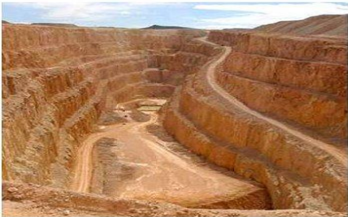
Fotografía N° 08: Parecido a lo mostrado en esta fotografía sería el paisaje que quedaría, al cierre de la mina; habría alrededor también unas mallas metálicas;