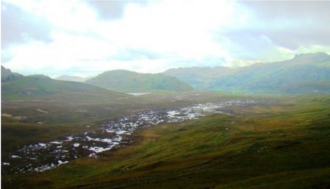
Fotografía N° 02: Bofedales y laguna El Perol al fondo; antes de la ejecución del proyecto.