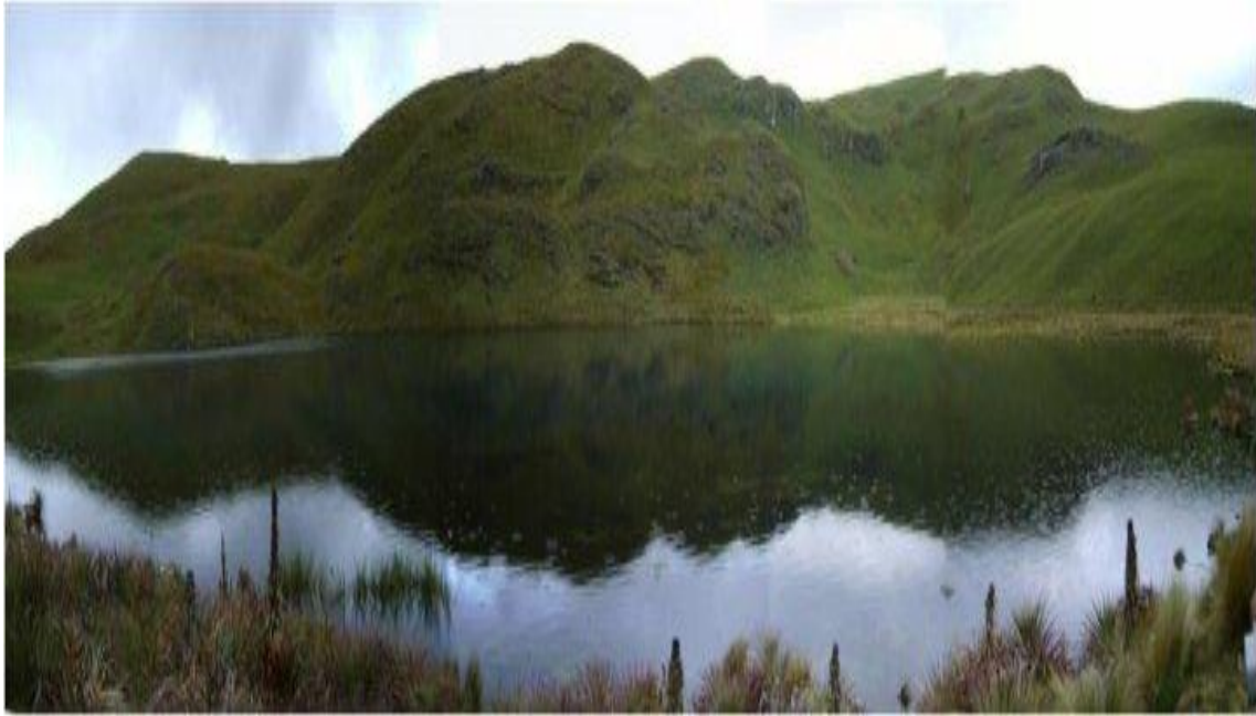
Fotografía N° 04: En esta fotografía podemos apreciar el estado actual de la laguna AZUL, sería total y definitivamente destruida si el Proyecto Conga se ejecutara.