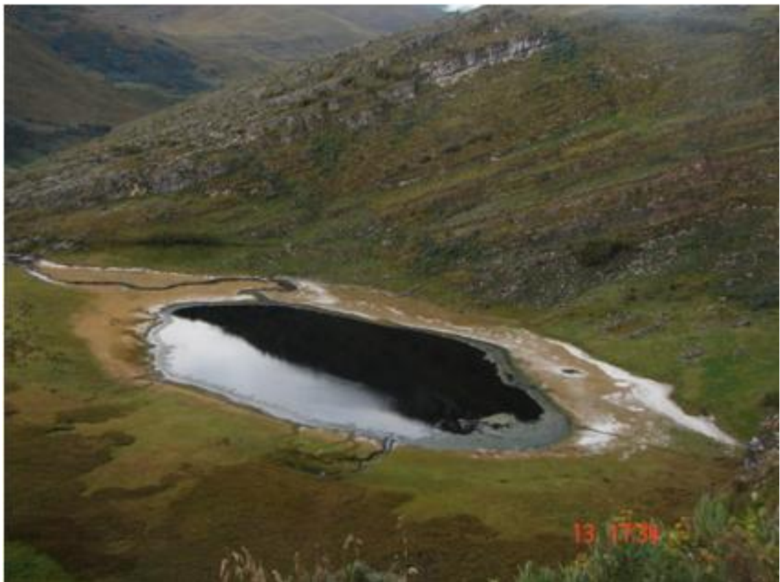
Fotografía N° 05: Esta es la Laguna Chica; al igual que la laguna anterior; sería total y definitivamente destruida ; si se llevara a efecto la ejecución del Proyecto Conga.