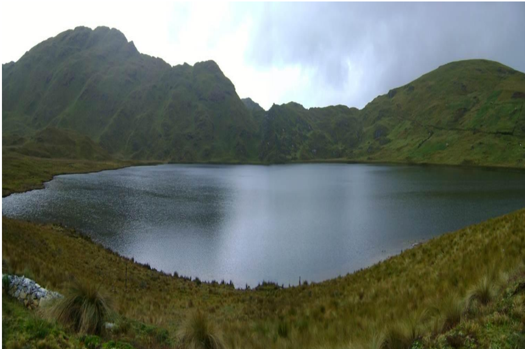
Fotografía N° 01: Laguna El Perol tal como está en la actualidad. Esta laguna según lo expuesto en el Proyecto Conga será eliminada total y definitivamente.

En este tajo se van a eliminar totalmente la laguna EL PEROL y los BOFEDALES ANEXOS; para realizar los trabajos de excavaciones; y las lagunas AZUL Y CHICA; para colocar todos los materiales sobrantes de las excavaciones. Al destruir estas lagunas serán eliminados y/o contaminados; todos los puquiales; que son alimentados por el agua de dichas lagunas.