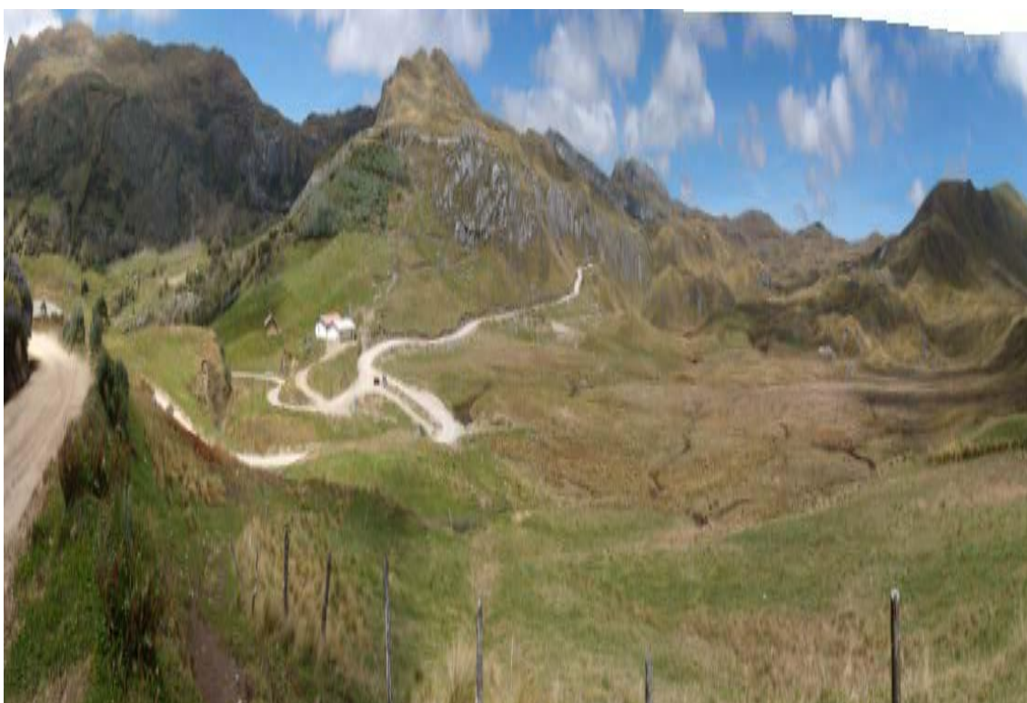
Fotografía N° 10: Vista panorámica hacia el cerro Chailhuagón, al fondo el cerro Fierruyoc. Área destinada para el depósito de desmonte Chailhuagón

Este depósito ocupará un área de CIENTO SESENTA Has; en esta zona serán colocadas las CIENTO SESENTA MILLONES DE TONELADAS, de materiales de desmonte y minerales de baja Ley; que posiblemente alcanzarán una altura de sesenta metros; la descripción de estos materiales es similar a las del tajo El Perol.