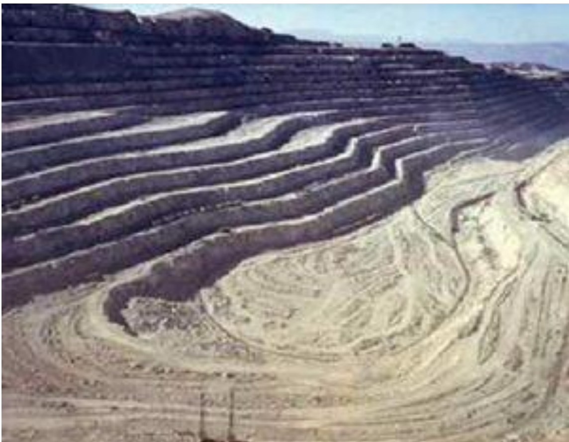
Fotografía N° 03: Esta fotografía es una descripción aproximada de cómo quedaría; la zona de la laguna El Perol y los bofedales anexos. La minera YANACOCKA (Compañía de Minas Buenaventura (CMB), Newmont Mining Corporation (Newmont) y la Corporación Financiera Internacional (IFC));