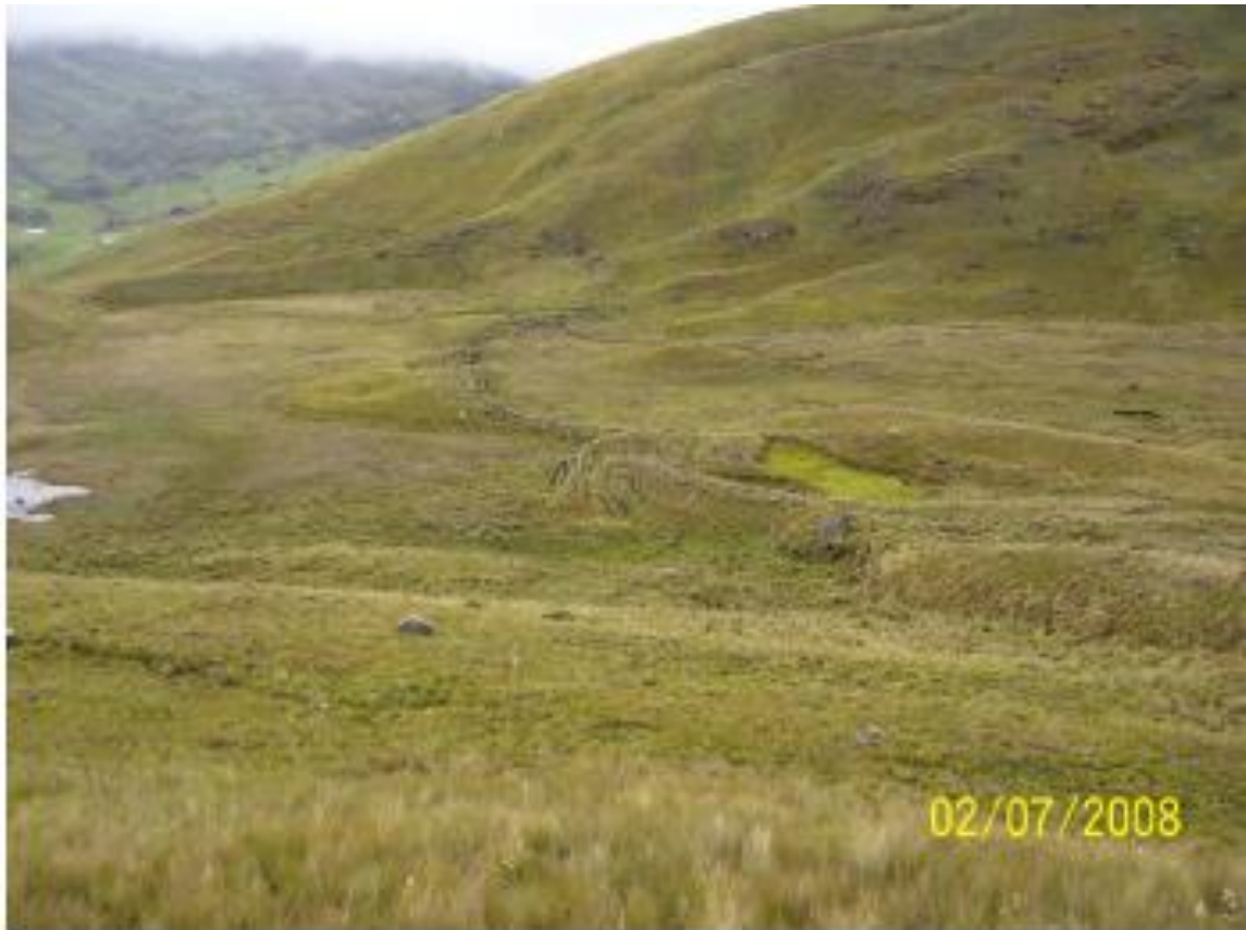
Fotografía N° 14: Vista de la ubicación de la zona del Reservorio El Perol desde el Oeste.

Según los cálculos del Proyecto en el informe Anexo S Item 6.2 página 28 dice textualmente: