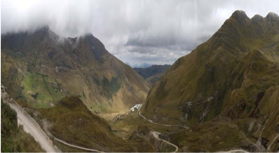
Fotografía N° 07: Se aprecia el fondo del valle donde se ubicará el tajo Chailhuagón

Este tajo se desarrollará en la parte baja de la Laguna Chailhuagón; ocupará una superficie de aproximadamente CIENTO CUARENTA Y TRES Has. Y tendrá un largo de mil ochocientos metros y una profundidad de aproximadamente TRESCIENTOS CINCUENTA METROS.